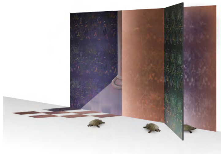
Paradis , Anne-Laure Sacriste, Grand Prix 2019 de la Cité internationale de la tapisserie, maquette du projet.

Dans cet imaginaire poétique créole, l'agglomération dans des teintes acides des références culturelles – de la peinture italienne du XVI e siècle à la sculpture antique, en passant par l'art africain – fait écho à la confrontation des factures, des différences de poids et de tombés, de trames et de textures.