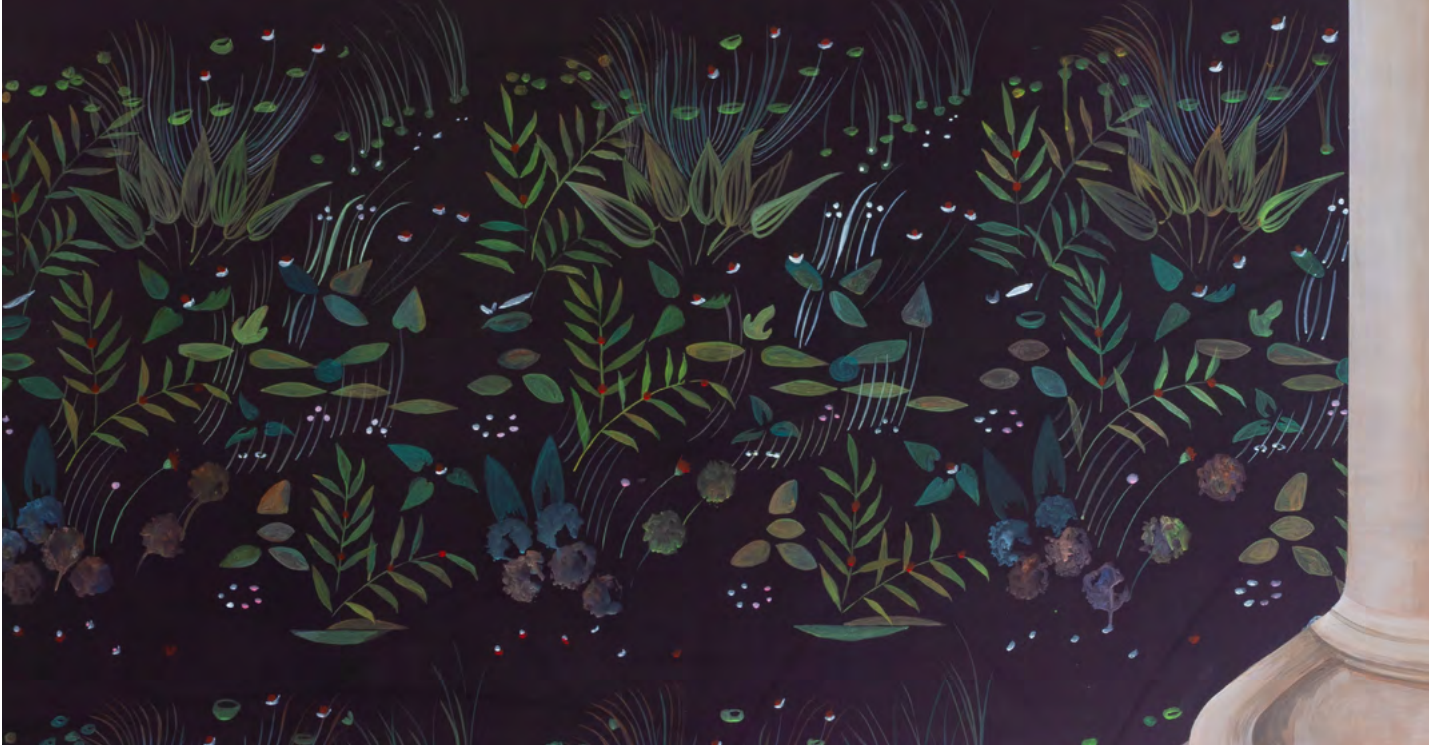
Paradis (détail) , Anne-Laure Sacriste, Grand Prix 2019 de la Cité internationale de la tapisserie. © Anne-Laure Sacriste

communiqué de presse Aubusson, 07 novembre 2019